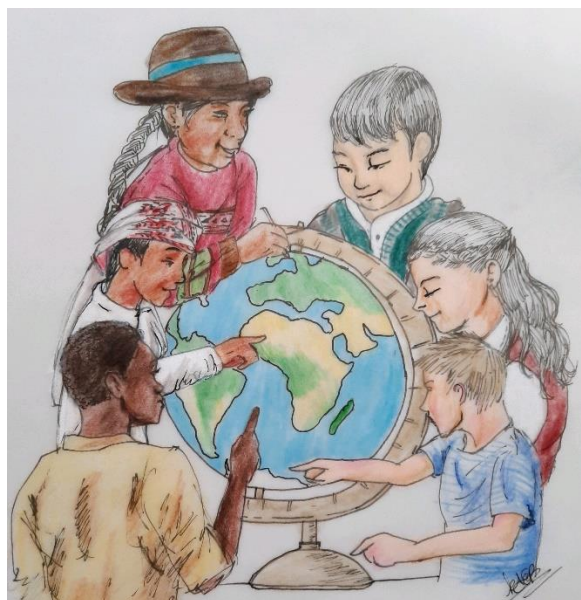
Reconnecting with your culture The School of the world (Kevin A. Echeverry, 2021)