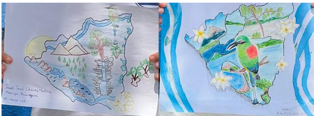
Imágenes 5: Patrimonio de Nicaragua (Autores RWYC Nicaragua)

Los embajadores de Nicaragua recrean distintos paisajes naturales de su territorio, dando un fuerte protagonismo al color azul, color que se manifiesta en los ríos, lagunas, cielo y mar del país centroamericano. Los escenarios son complementados por detalles de flora y fauna nativa de las regiones, teniendo en común el ave nacional del país “El Guardabarranco”.