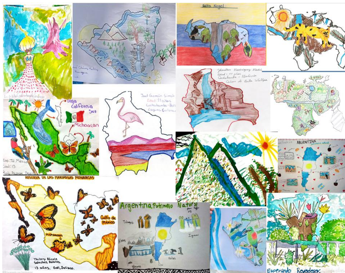
Ilustración I: Collage dibujos desde Latinoamérica expuestos en Estocolmo+50 (Autor: RWYC Communication, 2022).