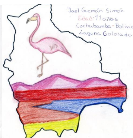
Imágenes 2: Patrimonio Boliviano (Autores de Der. Izq. Jael Guzman, Jhoel Vela)