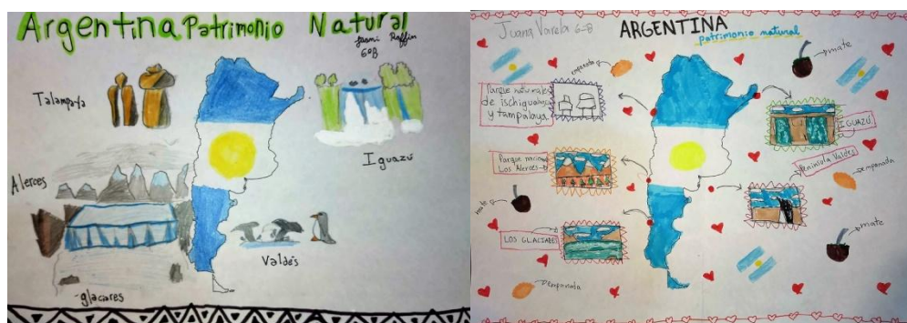
Imágenes 1: Patrimonio argentino (Autores de der. a Izq. Juan Varela, Juani Raffi)