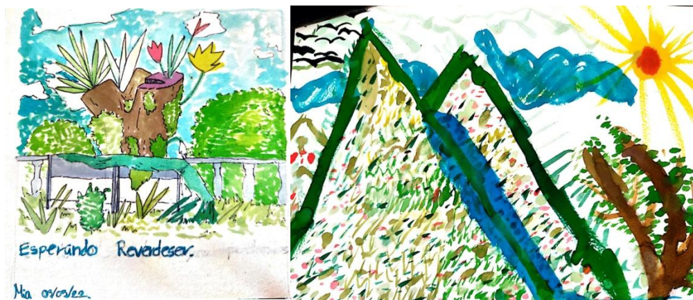
Imágenes 3: Patrimonio de Colombia (Autores de der. a Izq. s.a., Mia)

En el caso de Colombia, los dibujos realizados para la exposición, fueron creados en forma de protesta ante la decisión por parte de la administración de la ciudad de Ibagué-Tolima, de cortar con una serie de árboles centenarios en el centro de la ciudad. Gracias a la acción de la ciudadanía y el descontento manifestado desde expresiones artísticas y colectivas, fue posible evitar el proyecto “Parque Centenario” el cual talaría un porcentaje de árboles nativos de la región y el parque, para asfaltar la zona y construir escenarios en concreto.