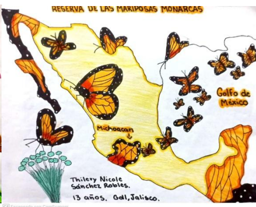
Imágenes 4: Patrimonio de México (Autores de Der. a Izq. Axel Santiago Ortiz, Nicole Sanchez).