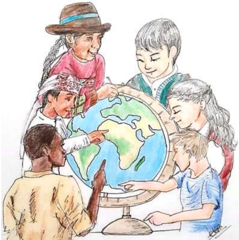
Reconecte-se com sua Cultura A Escola do Mundo (Kevin A. Echeverry, 2021)