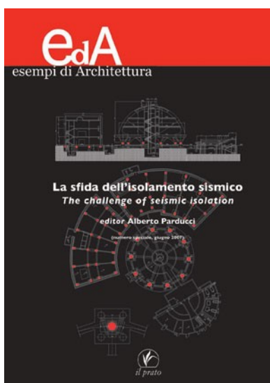
Eda numero speciale 2007

Per un ritrovato valore dello spazio collettivo a cura di Chiara Visentin Testo: italiano + abstract in inglese