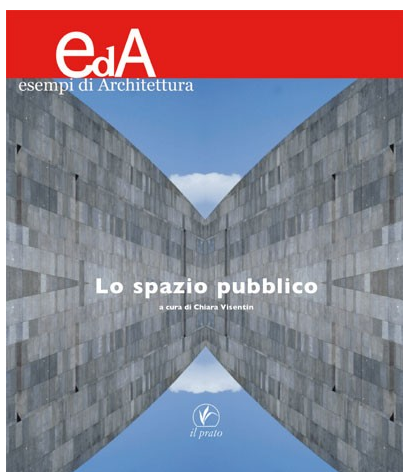
Eda numero 1 -2007

Per un ritrovato valore dello spazio collettivo a cura di Chiara Visentin Testo: italiano + abstract in inglese